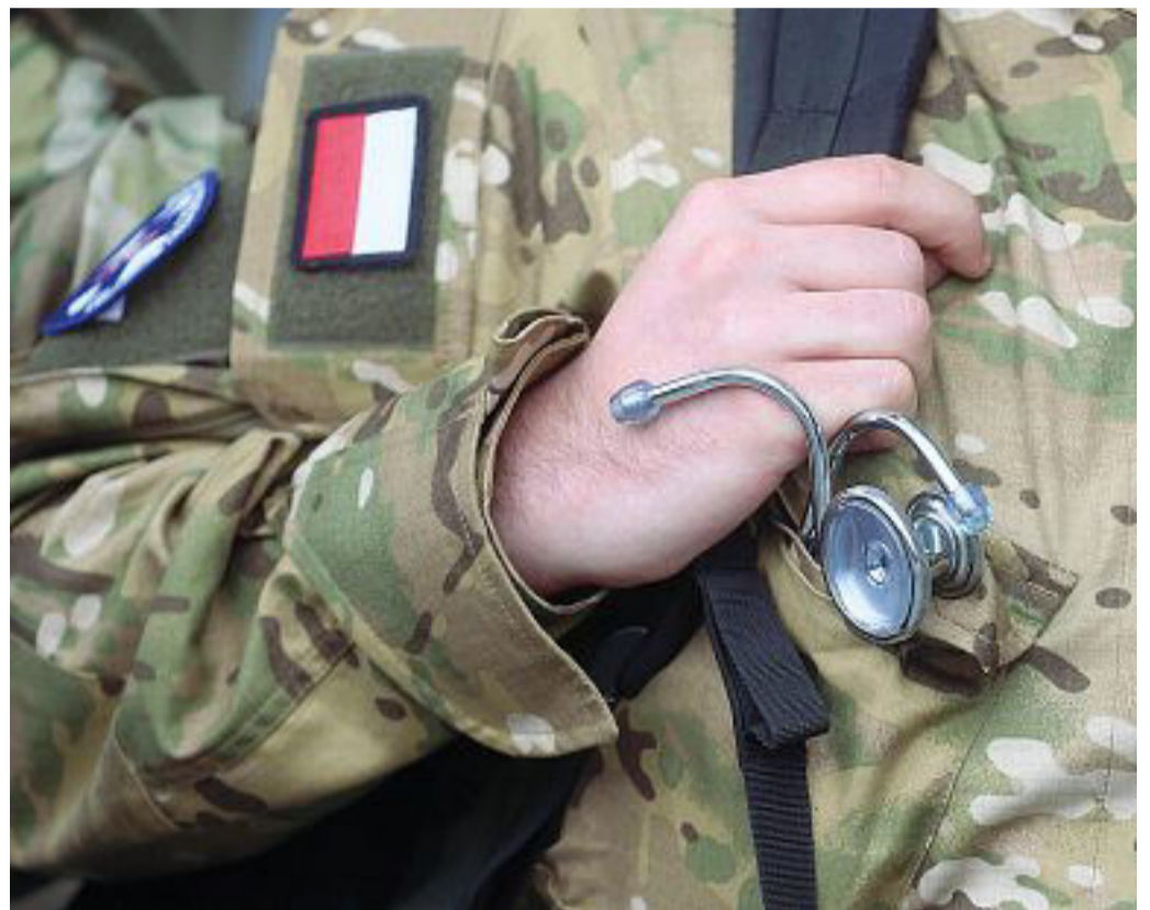
Cooperazione Medici e infermieri militari polacchi all'aeroporto di Orio al Serio, Bergamo

«Un piano granulare Ecco ciò che serve per ripartire tutti ma un po' alla volta»