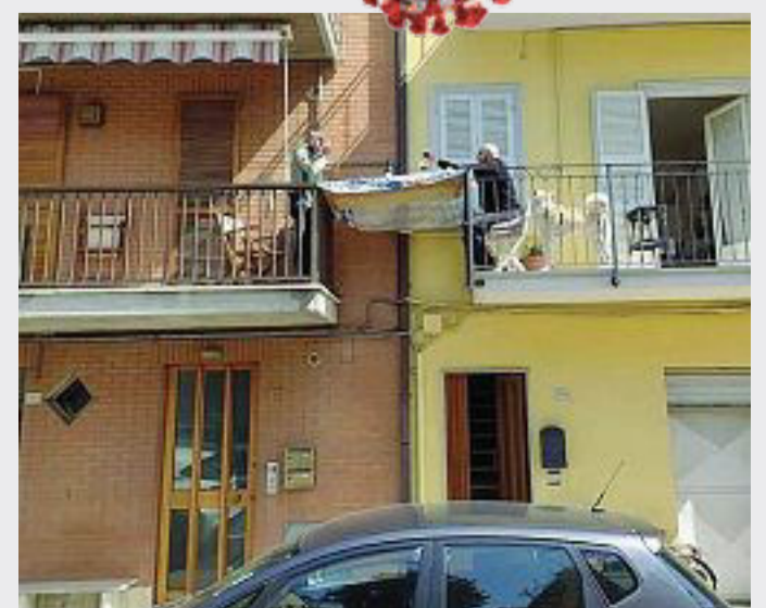
Nelle Marche Il rito del pranzo domenicale, ma sul balcone, per due vicini

Come ex direttrice del Centro nazionale epidemiologia, sorveglianza e promozione della salute (Cneps) dell'Istituto Superiore di Sanità, si è avvalsa di questi strumenti in